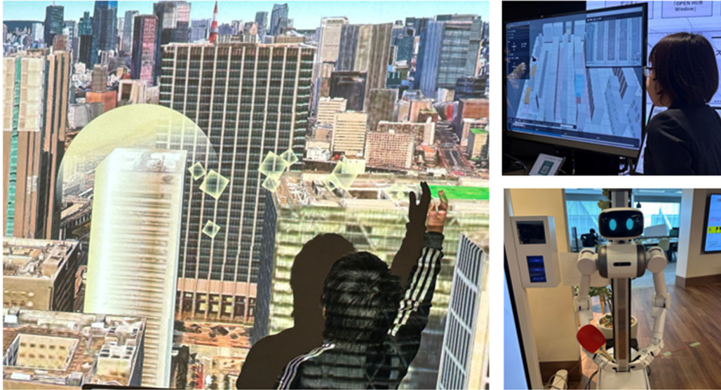
図2. IOWN ショーケース (イメージ)

本イベントでは数 10 キロメートル離れた街と品川の会場をつなぎ、高速大容量、高精細な映像伝送によるコンテンツ体験やデジタルツイン *4 ソリューションの紹介を通して、来場者に未来の街のあり方を思い描く機会を提供します。企業、地域の皆様から本イベントを通して IOWN を活用した街づくりにおける新たな視点やアイデアを募り、新サービスやユースケース創出をめざします。