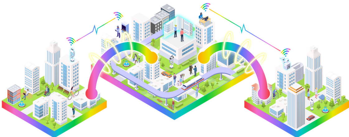
図 1. 未来をつなぐ街づくり×IOWN（イメージ）

今後も、本施設を活用し 3 社で連携して、さまざまな実証実験やユースケース創出に取り組む予定です。