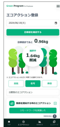
エコアクションの例