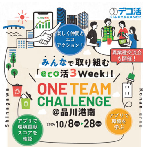
実践したエコアクション をアプリに登録

NTTアーバンソリューションズ株式会社（以下「NTTアーバンソリューションズ」）、NTTコミュニケーションズ株式会社（以下「NTT Com」）、NTTコムウェア株式会社（以下「NTTコムウェア」）の3社（以下「NTTグループ3社」）は、環境省が推進する「デコ活」 ※1 の一環として、2024年10月8日から10月28日までエコアクションキャンペーン「ONE TEAM CHALLENGE 品川港南」（以下「本キャンペーン」）を開催しました。本キャンペーンでは、品川港南エリア内の複数企業が参加、参加従業員の約9割の環境意識が向上、8,835.5kgのCO 2 削減に相当する ※2 18,059回のエコアクション ※3 が実践されました。