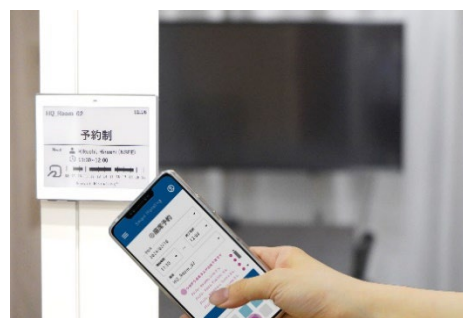
予約・利用状況が分かる「電子ラベル」 (オプションサービス)