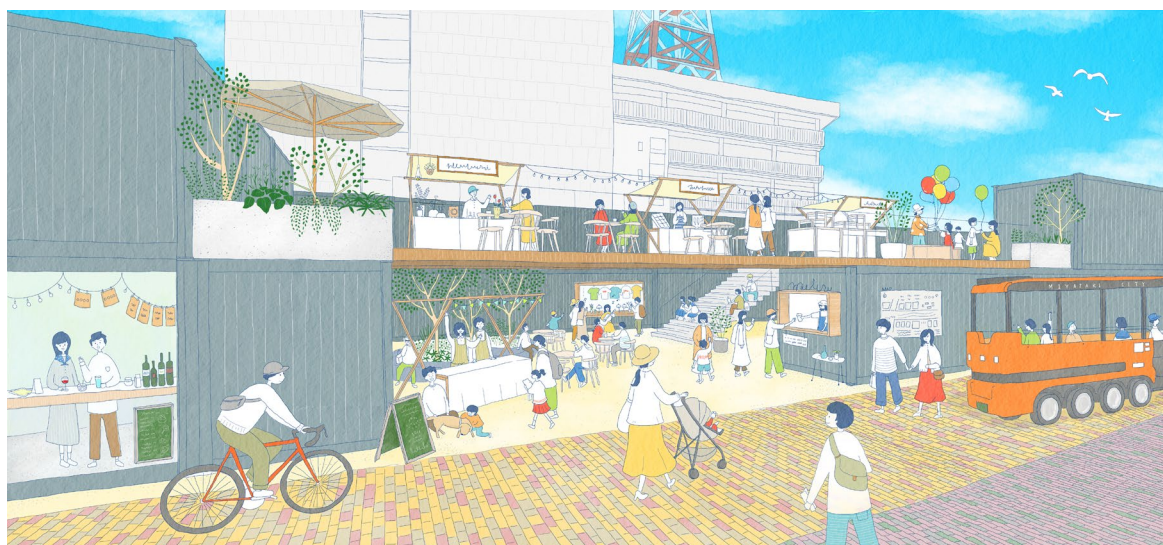
広島通り側から見た賑わいのイメージパース

具体的には、NTT 局舎として長年地域のみなさまに親しまれている旧 NTT 宮崎支店北棟を、商業（1 階）とオフィス（2～3 階）の複合施設としてリノベーションし 2025 年春開業する予定です。また南棟は、既存建物を撤去し、低層の商業施設を計画します。活気にあふれ、人々が集まりたくなるような施設として 2024 年秋開業をめざします。